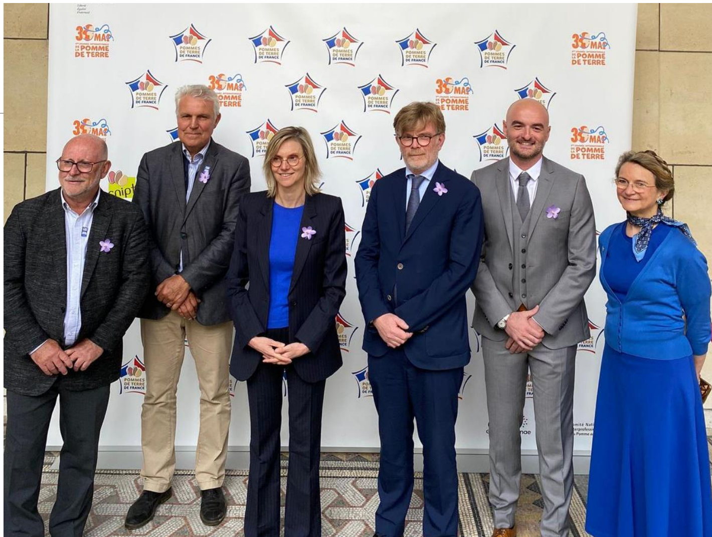
Première journée internationale de la pomme de terre – 30 mai 2024